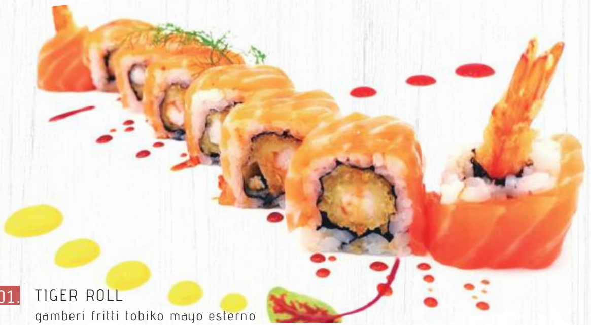
101. TIGER ROLL gamberi fritti tobiko mayo esterno salmone pasta kataifi teriyaki € 12,00