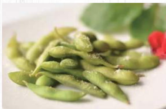
3. EDAMAME 3.50 (fagioli di soia)