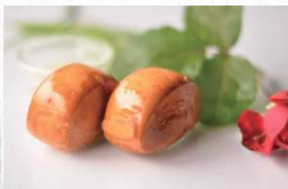
5. PANE CROCCANTE 2PZ 3.00