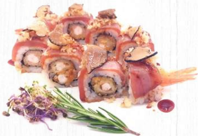
105. TATAKI TUNA ROLL gambero fritto, avocado, philadelphia, esterno tonno scottato salsa teriyaky tartufo € 13,00