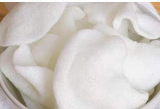
6. NUVOLE DI DRAGO 1.50