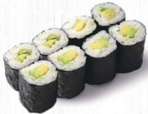
72. AVOCADO MAKI € 4,00