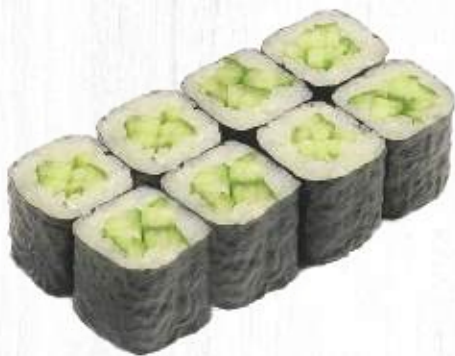
77. KAPPA MAKI cetriolo € 3,50