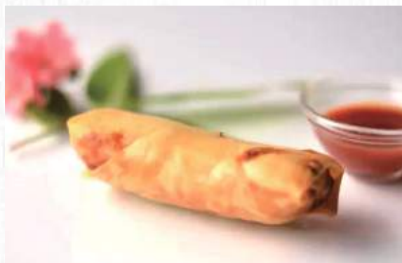
1. INVOLTINO PRIMAVERA 2PZ 2.00 (verdure)