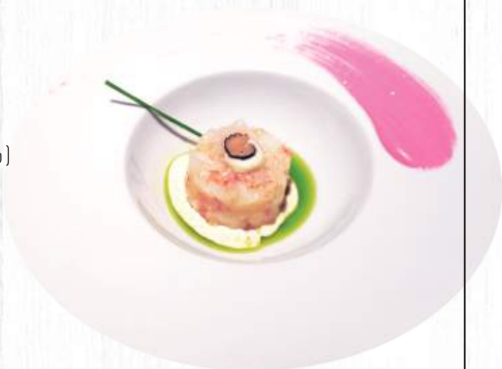
124. TARTARE KAMPO (salmone crudo,mango) max 1pz € 8,00