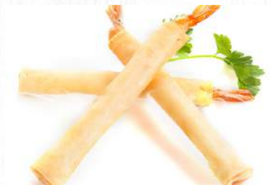
2. HARUMAKI 2PZ 3.00 (involtino di gamberi)