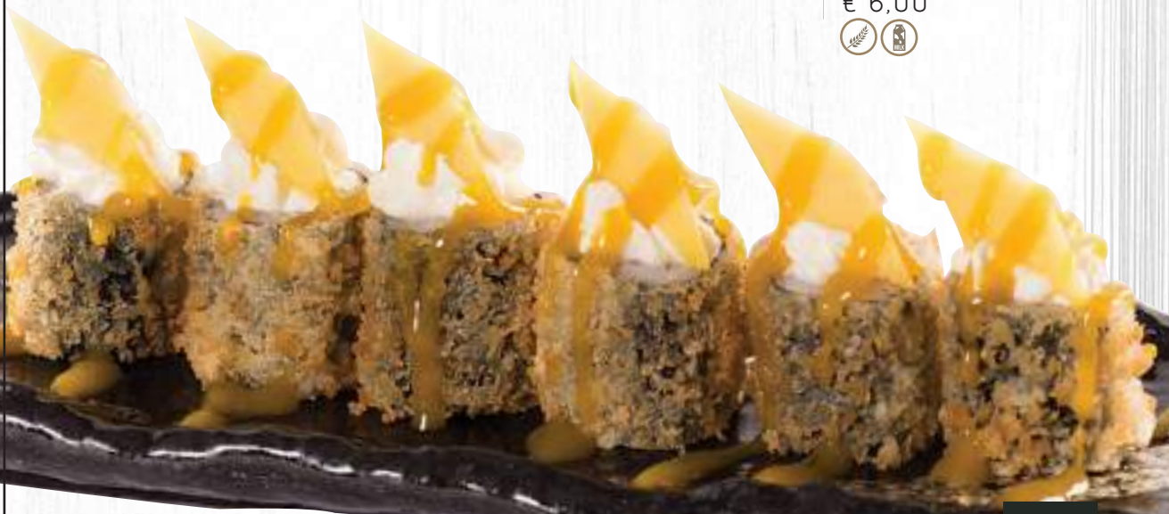
75. HOSSOMANGO € 6,00