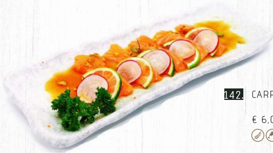
142. CARPACCIO SALMONE