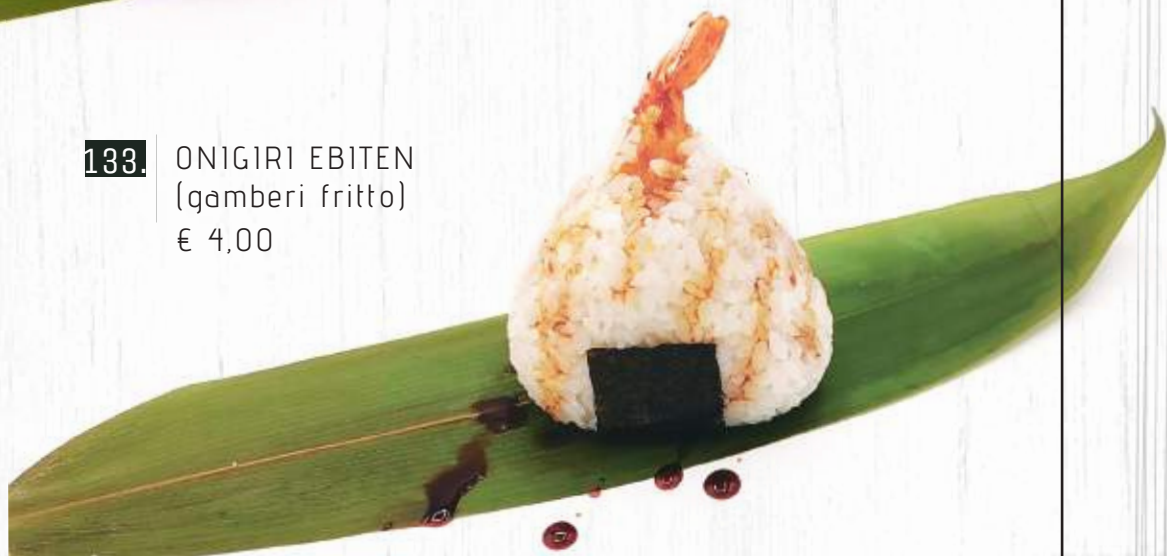
133. ONIGIRI EBITEN (gamberi fritto) € 4,00