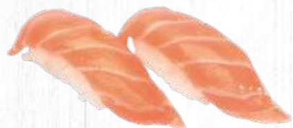
34. | SAKE salmone crudo 3.00€