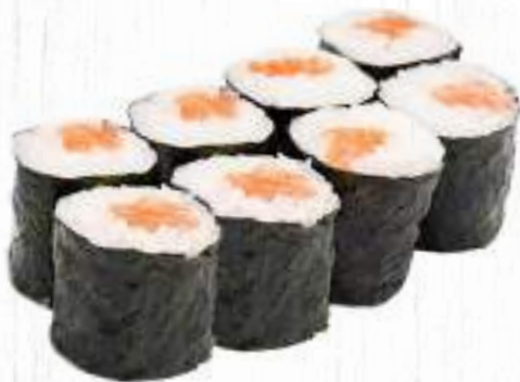
71. SAKE MAKI salmone € 4,00