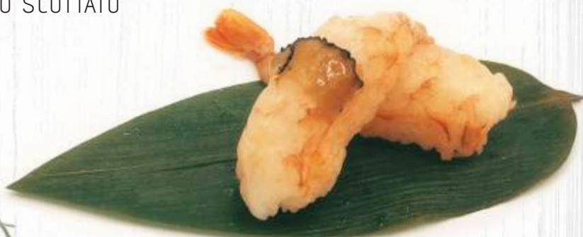
119. NIGHIRI AMAEBI 2pz € 4,00