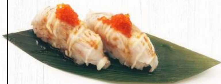
118. NIGHIRI BRANZINO SCOTTATO 2pz € 4,00