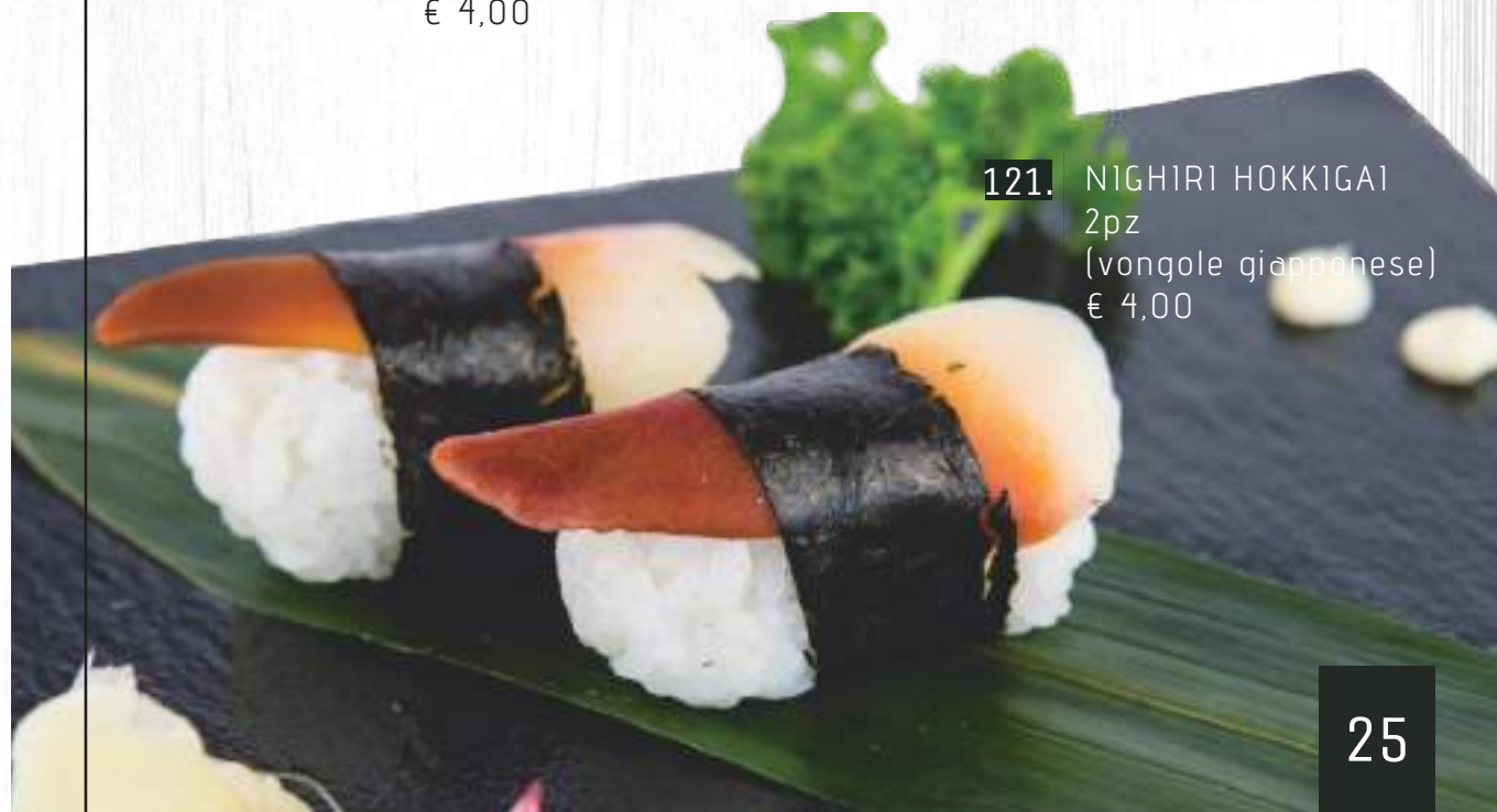
121. NIGHIRI HOKKIGAI 2pz (vongole giapponese) € 4,00