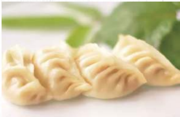
9. RAVIOLI CON CARNE 4pz € 3,00