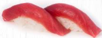
35. | MAGURO tonno crudo 3.50€