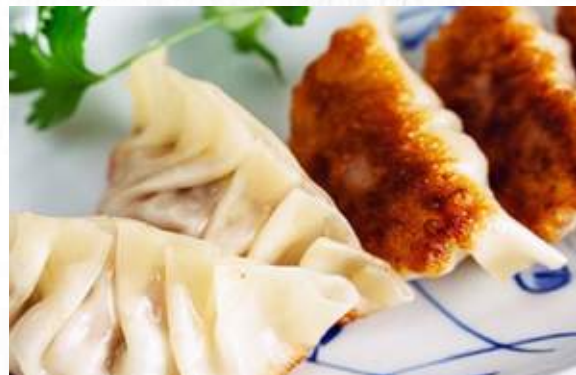
11. SHAO MAI 4pz (gamberi e carne) € 3,50