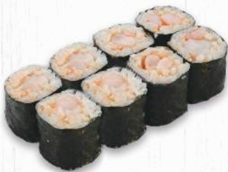
74. EBI MAKI gamberi cotto € 4,50