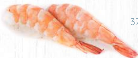
37. | EBI gamberi cotti 3.50€