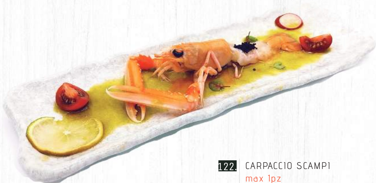
122. CARPACCIO SCAMPI max 1pz € 7,00