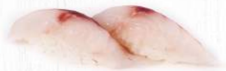
36. | SUZUKI branzino crudo 3.00€