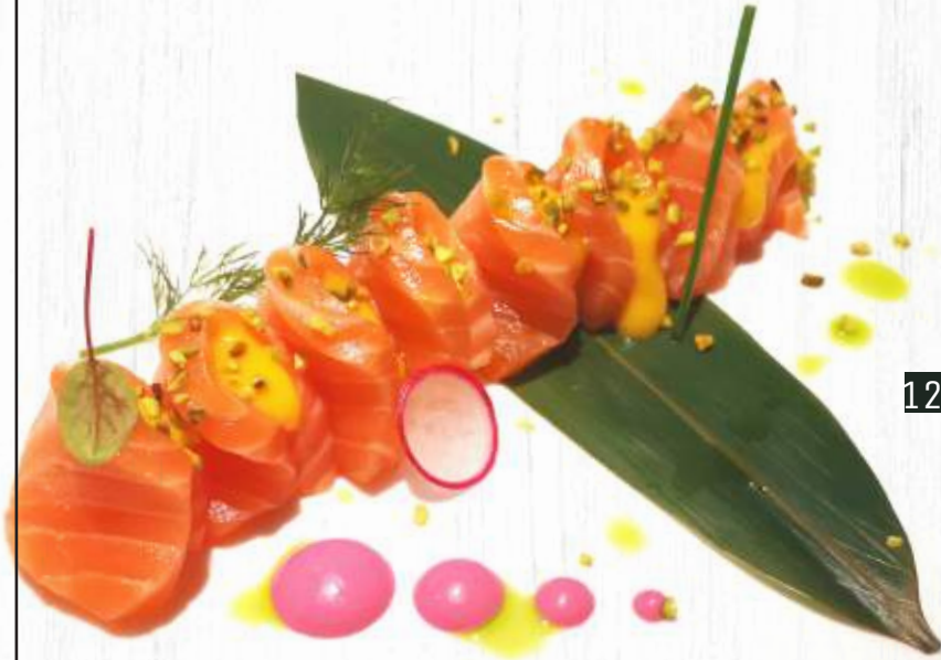
126. FANTASI SASHIMI SAKE salsa mango. pistachio max 1pz € 8,00