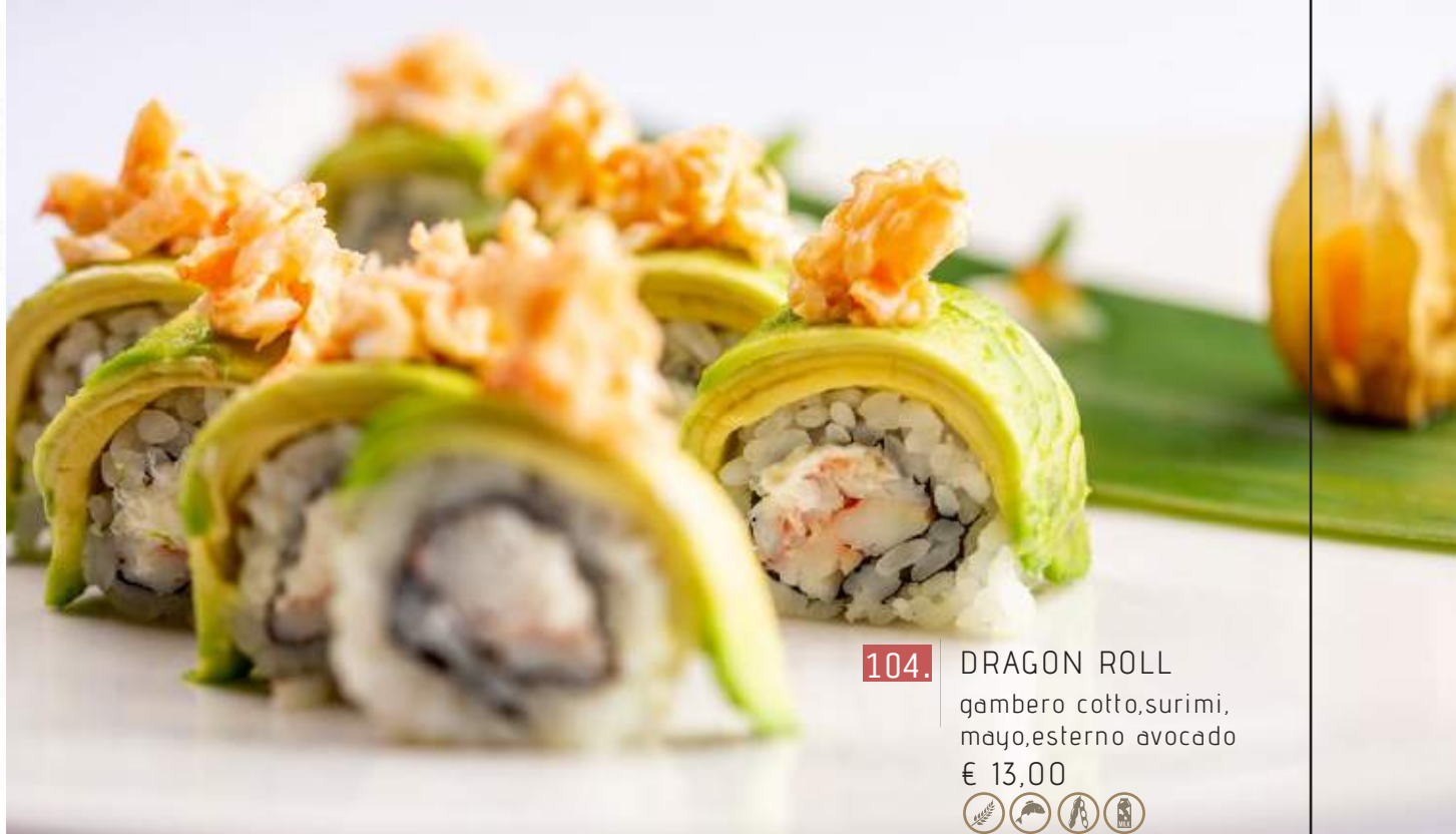
104. DRAGON ROLL gambero cotto, surimi, mayo, esterno avocado € 13,00