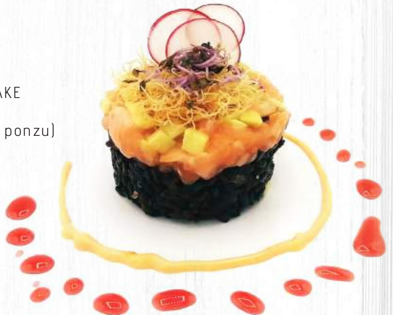
135. CHIARASHI BLACK SAKE (salmone,riso nero, avocado,kataifi,salsa ponzu) € 8,00