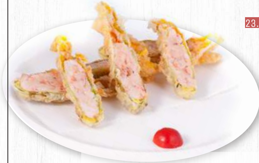
23. FIORE DI ZUCCA tempura di fiore di zucca con gamberi