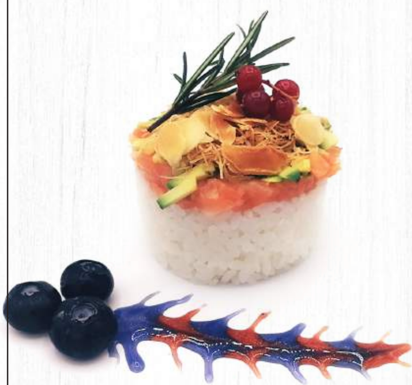
134. CHIRASHI SAKE (salmone,riso,avocado, kataifi,salsa ponzu) € 8,00