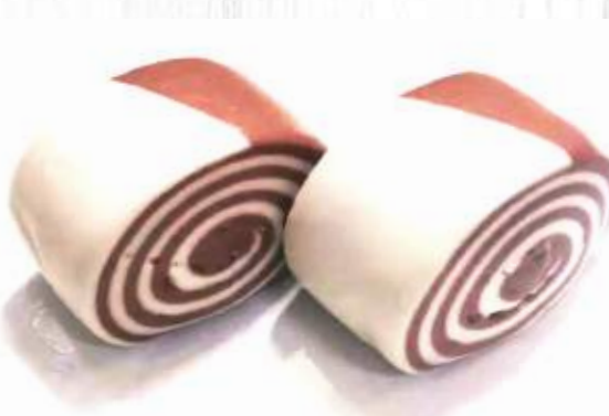
4. PANE AL CIOCCOLATO 2.50