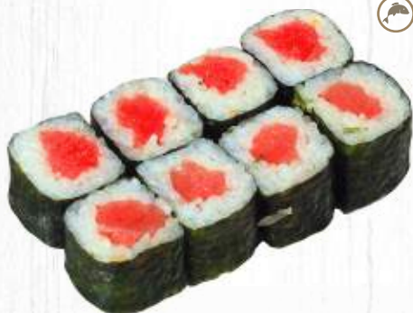
73. TONNO MAKI tonno € 4,50