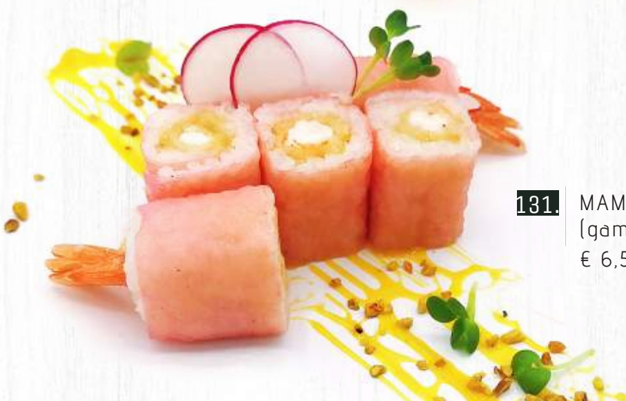
131. MAME NORI EBITEN (gambero fritto) € 6,50