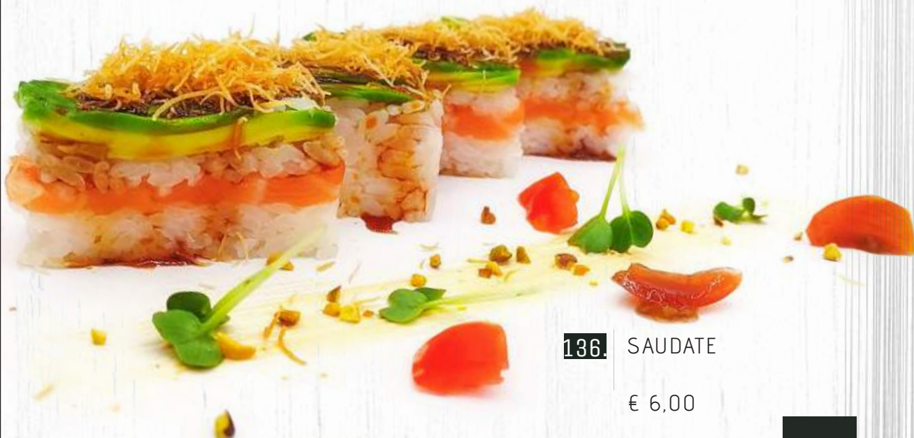
136. SAUDATE € 6,00