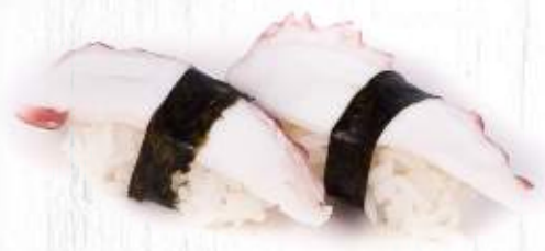
38. | TAKO POLIPO COTTO 3.50€