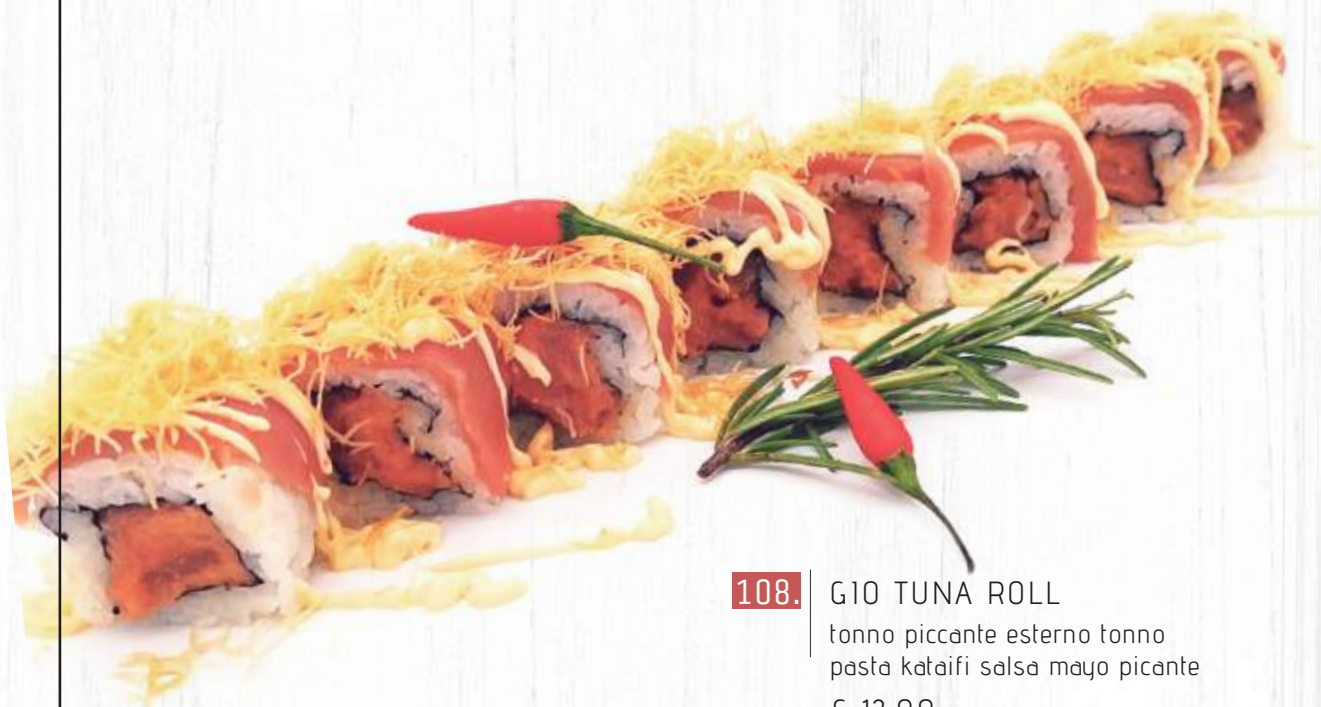
108. GIO TUNA ROLL tonno piccante esterno tonno pasta kataifi salsa mayo piccante € 12,00