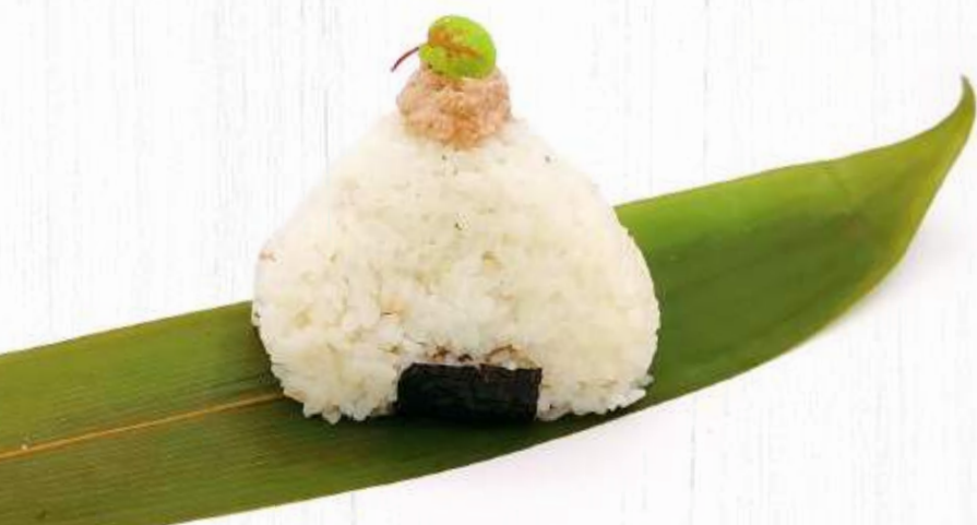
132. ONIGIRI TONNO (tonno cotto) € 3,50