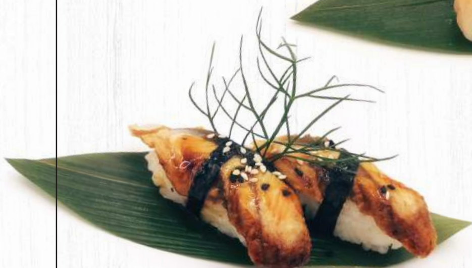
120. NIGHIRI ANGUILLA 2pz € 4,00