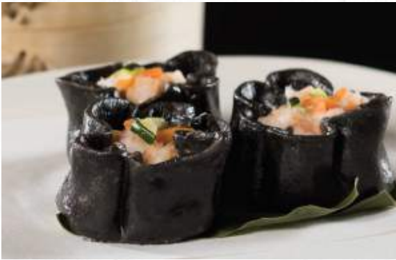
7. RAVIOLI NERO DI SEPPIA 4pz € 5,00